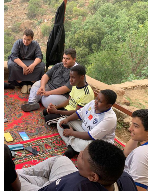
تعليم الأبناء العاب الذكاء والمنافسات بين المجموعات في الثقافي