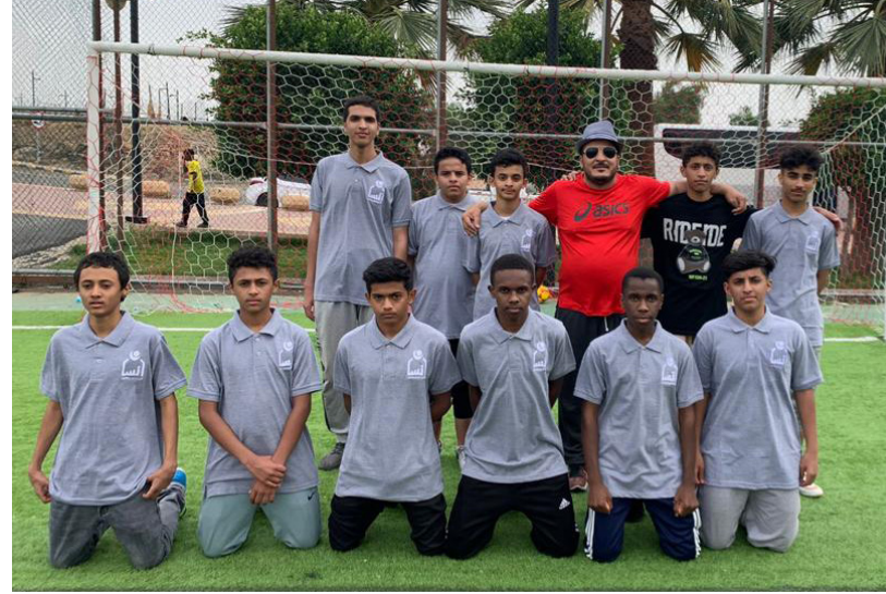
صور من المنافسة الرياضية بين جمعية انسان واكاديمية جازان