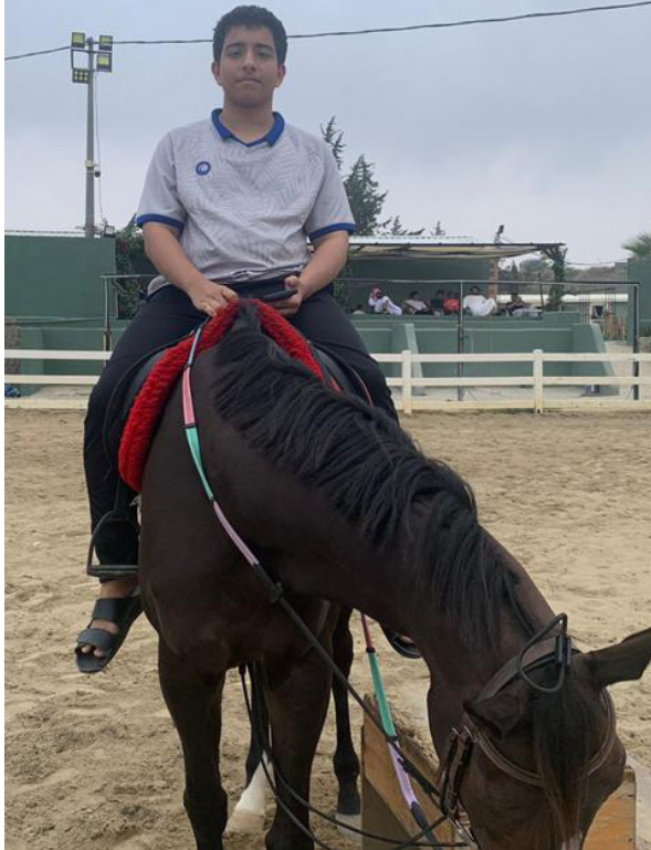
تعليم الأبناء طريقة ركوب الخيل